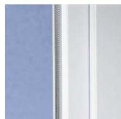
Klassiek design met afgeronde kanten

Ze zijn een aanwinst voor elk huis: ramen met moderne kunststof profielen van VEKA. Want het klassieke design met de licht afgeronde kanten van het SOFTLINE profiel-systeem is tijdloos. Daardoor is het perfect te combineren met de meest uiteenlopende bouwstijlen – van traditioneel tot modern. Ideaal voor zowel renovatie als nieuwbouw.