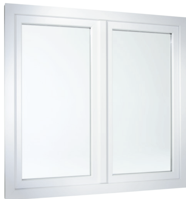
Ramen met dubbele vleugels in verspringende uitvoering

Het is overigens niet alleen het uiterlijk van SOFTLINE 70 dat indruk maakt. De techniek binnenin is al even overtuigend. De meerkamerprofielen maken optimaal gebruik van de isolerende eigenschap van lucht, waardoor ze voldoen aan de hoogste eisen ten aanzien van warmte-isolatie. Dat zorgt niet alleen voor een aangenaam binnenklimaat bij elk weertype, maar draagt in de winter ook bij aan een merkbare verlaging van de stookkosten.